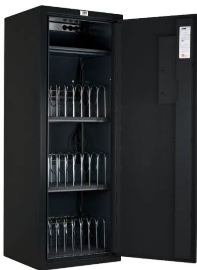
Modello 24 alloggiamenti