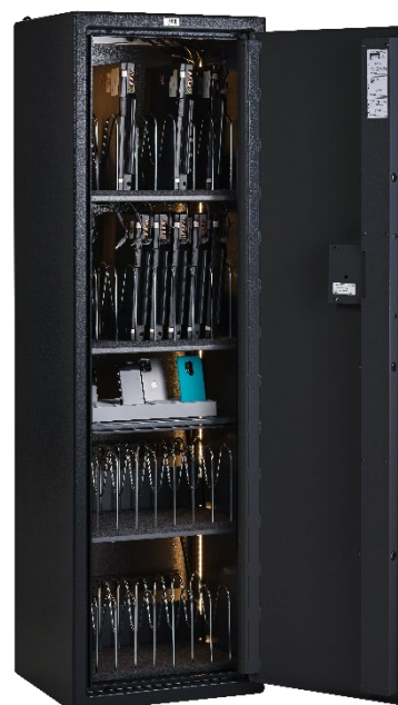
Modello 32 alloggiamenti