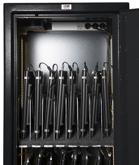
Dettaglio ventilazione (opzionale sul modello 16 alloggiamenti)

Packaging: Imballaggio in plastica PE prodotto con il 50% di granuli riciclati certificati