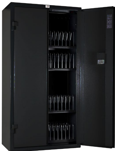
Modello 60 alloggiamenti